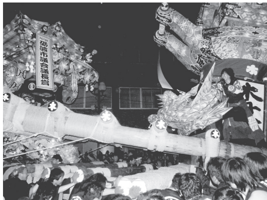
写真2 突き合わせ（木舟町对新富町）

棒が突き出ており、ここを相手の行燈にぶつけるのである（写真2）。ぶつかった後は、町によって戦法が異なる。練り棒を相手の練り棒の下に潜らせて押し込む、逆に練り棒を上げて相手の行燈を上から壊す、左右にゆさぶって相手の行燈を横向きにするなど、事前の作戦はあるが、ただ戦局に応じて、行燈上のマイクを持ったリーダーの指示で、臨機応変に作戦を変える。勝敗の明確な基準はないが、一方的に押し込むなど優劣がはっきりしたら、裁許のホイッスルで押し合いをやめる。制限時間内であれば、いったん離れて再度ぶつかり合う。時間管理は砺波夜高振興会の常任理事が行う。20分の制限時間内に2～3回の突き合わせが行われる。